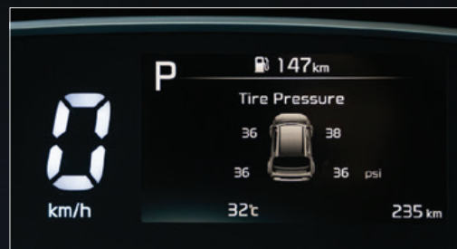
Cảm biến áp suất lốp