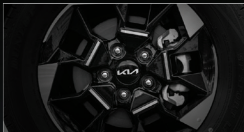
Hệ thống phanh đĩa trước và sau