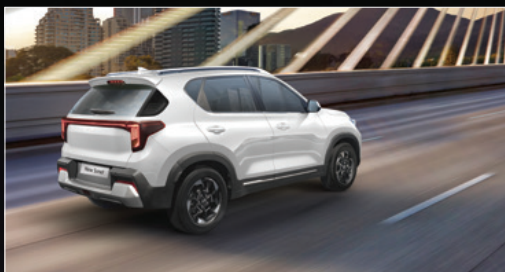
Điều khiển hành trình & hỗ trợ giới hạn tốc độ

Trang bị tính năng an toàn thông minh mang lại sự tự tin cho người lái và đảm bảo an toàn tối ưu cho mọi điều kiện vận hành.