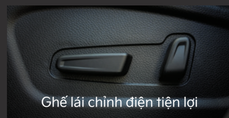
Chế lái chỉnh điện tiện lợi