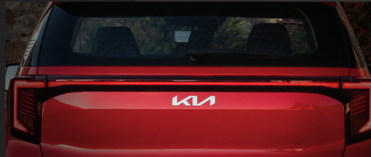
Dải đèn LED nổi liền mở rộng theo phương ngang bề thế