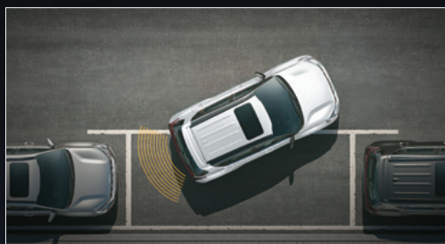
Cảm biến hỗ trợ đỗ xe phía sau