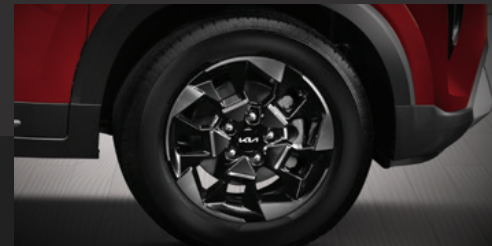
Mâm hợp kim 16 inch