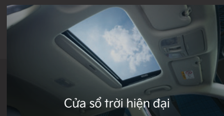
Cửa sổ trời hiện đại