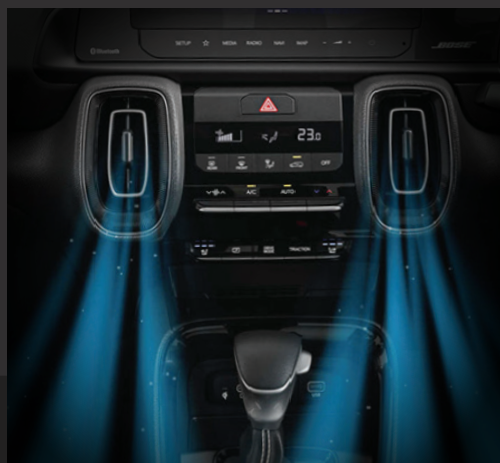
Hệ thống điều hòa tự động