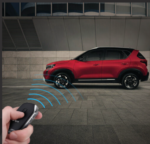
Chìa khóa thông minh + khởi động từ xa