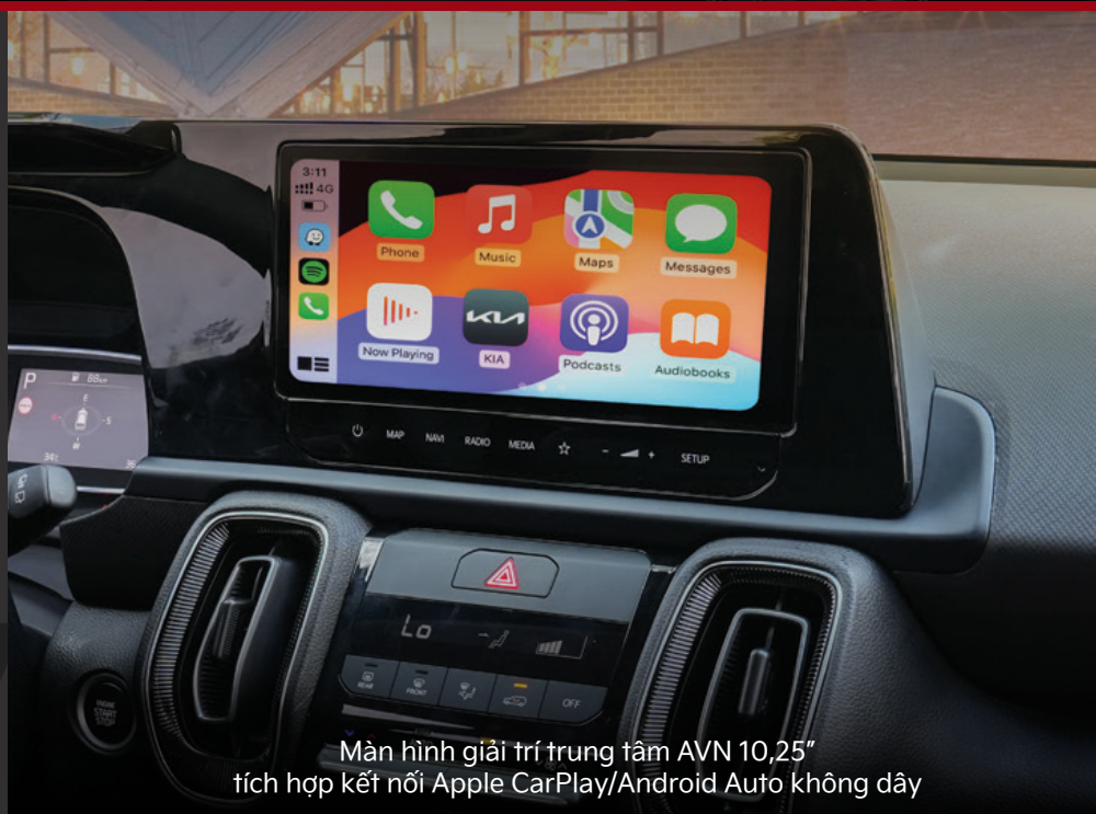
Màn hình giải trí trung tâm AVN 10,25" tích hợp kết nối Apple CarPlay/Android Auto không dây

Khoang nội thất với thiết kế hiện đại, các chất liệu cao cấp tạo không gian sang trọng, nhiều trang bị tiện ích hỗ trợ hành khách.