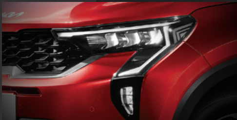
Đèn định vị LED thiết kế Star-map bắt mắt