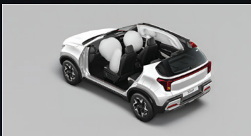
6 túi khí