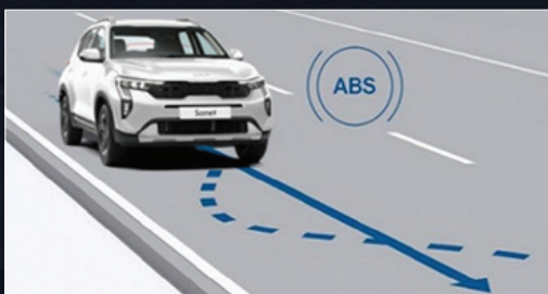
Hệ thống chống bó cứng phanh ABS