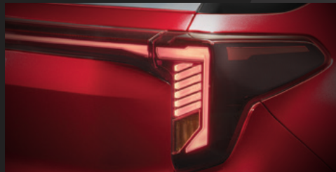
Cụm đèn sau thiết kế Star-map đồng nhất