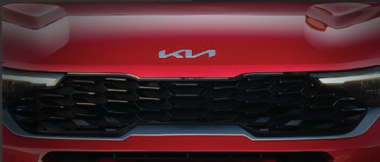
Lưới tản nhiệt mũi hổ thiết kế họa tiết hình sóng

Thiết kế mới thể thao đậm chất SUV với các hình khối góc cạnh, họa tiết tương phản tạo nên diện mạo bề thế, mạnh mẽ thể hiện phong cách cá tính và năng động.