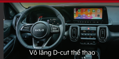
Vô lăng D-cut thể thao