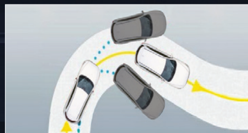
Hệ thống cân bằng điện tử ESC