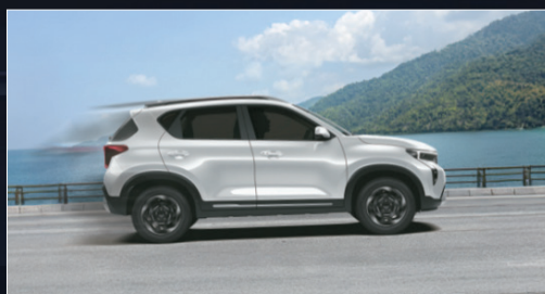
Hệ thống khởi hành ngang dốc HAC