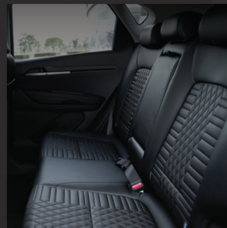
Nội thất da sang trọng